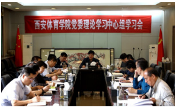
西安体育学院党委理论学习中心组学习会

国共产党的发展史，是执着于追求被压迫人民解放的历史，是中国共产党人抛头颅洒热血，执着于为人民求自由、谋幸福的历史。我们每一位新时代的共产党员，都要坚持这种执着，不懈追求，为建设富强、民主、文明、和谐、美丽的中国特色社会主义奋力拼搏。信心就是动力，就是勇气。我们充满信心建设新时代中国特色社会主义事业的动力来自于马克思主义理论的科学指导，来自于毛泽东思想、邓小平理论、“三个代表”重要思想、科学发展观、习近平新时代中国特色社会主义思想的引领，勇气来自于不朽的中华民族基因，来自于伟大的红色文化传承，来自于中国特色