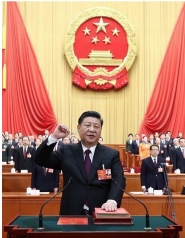
3月17日，十三届全国人大一次会议在北京人民大会堂举行第五次全体会议。习近平当选中华人民共和国主席、中华人民共和国中央军事委员会主席。这是习近平进行宪法宣誓。

(二十) 将中央防范和处理邪教问题领导小组及其办公室职责划归中央政法委员会、公安部。