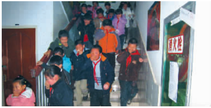
交大附小南校区学生正在进行安全演练

9月26日，昆明市明通小学发生踩踏事故，造成学生6人遇难、26人受伤；国庆期间海南连发三起学生溺水事故……这些都让人们再次关注学生安全教育问题。那么，对于学生的安全教育到底该怎么做？该如何改进和强化？记者对此进行了采访。