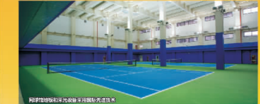
网球场地和采光设备采用国际先进技术