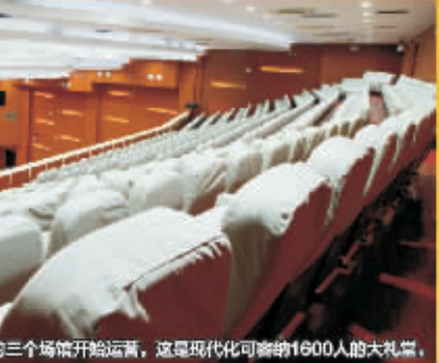
投资2亿元新建的三个场馆开始运营，这是现代化可容纳1600人的大礼堂。